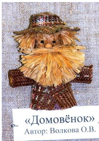
«Домовёнок» Автор: Волкова О.В.

В школе «Флорис» многие работы флористов посвящены сказкам разных народов.