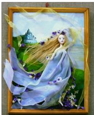
Волкова О.В. «Из сказочной страны».

Флористы и сами сочиняют свои сказки. Так появилась фея Флорис, так появились её флотилия волшебных кораблей, заполненных цветами.