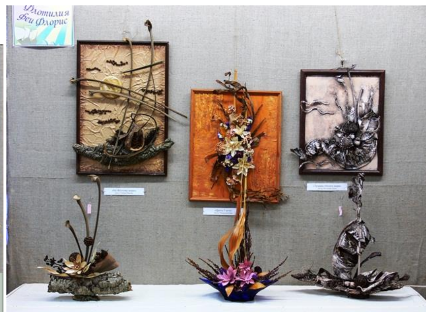
Флотилия Фей Флорис